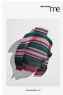
[ADC賞] イッセイ ミヤケ「me ISSEY MIYAKE」のポスター、ジェネラルグラフィック