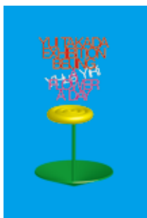
[ADC賞] NEUE DESIGN EXHIBITION PROJECT「高田唯 北京展」のジェネラルグラフィック