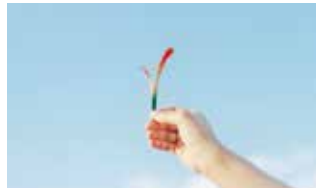
[ADC賞] 岡村印刷工業「興福寺中金堂落慶法要散華まわり花」のジェネラルグラフィック