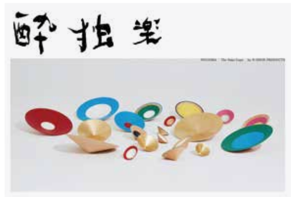
[ADC会員賞] D-BROS、津南醸造、アートフロントギャラリー・大地の芸術祭実行委員会「酔独楽」のジェネラルグラフィック、パッケージデザイン、環境空間、マーク&ロゴタイプ