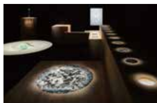
[ADC賞] ギンザ・グラフィック・ギャラリー「続々 三澤 通」の環境空間