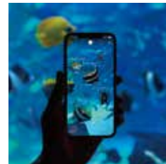
[ADC賞] Linne「LINNÉ LENS」のスマートフォンアプリ