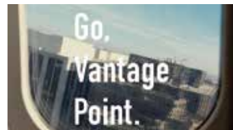
[ADC賞] 本田技研工業「企業広告」の商業フィルム