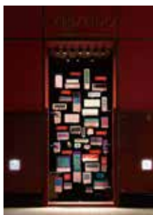
[ADC賞] 資生堂「Wording from Shinzo Fukuhara」の環境空間