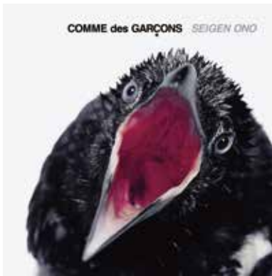
[ADCグランプリ] COMME des GARÇONS SEIGEN ONO / 日本コロムビアのポスター、ジェネラルグラフィック