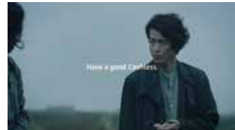
[ADC賞] 三井住友カード「企業広告」の商業フィルム