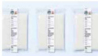
[ADC賞] 3cm market製作委員会「3cm market」のポスター、パッケージデザイン、マーク&ロゴタイプ