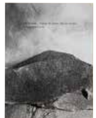
[原弘賞]「Yohji Yamamoto homage M,Cubisme / Mon cher Azzedine」のブック&エディトリアル