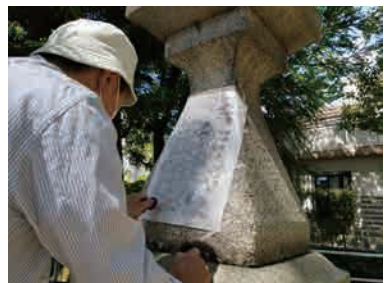
「布市神社奉納燈籠の探拓風景」↑