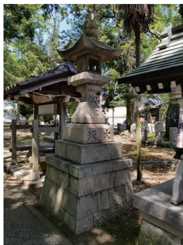
「布市神社奉納燈籠（大坂）」

今回、私は市役所の方と野々市本町二丁目の「布市神社」に奉納されている石燈籠の調査を見学してきました。神社の鳥居を潜ったすぐそばには、嘉永二年（一八四九）五月に建てられた左右一対の灯籠があり、向って右側に「大坂」、左側に「宮腰」と刻まれています。どちらの燈籠にも製作者である石工の名前「大坂長堀江戸屋七兵衛」とあります。何故大坂の人が作った燈籠が野々市の神社に奉納されているのでしょうか。それでは色々考えてみたいと思います。